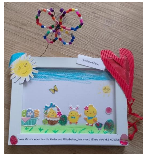
Dankbild der Kinder aus der Grimbergstraße