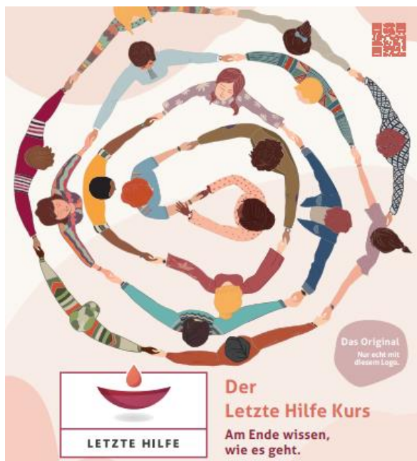
Bild: Auszug aus dem Hinweisplakat von Letzte Hilfe Deutschland gGmbH