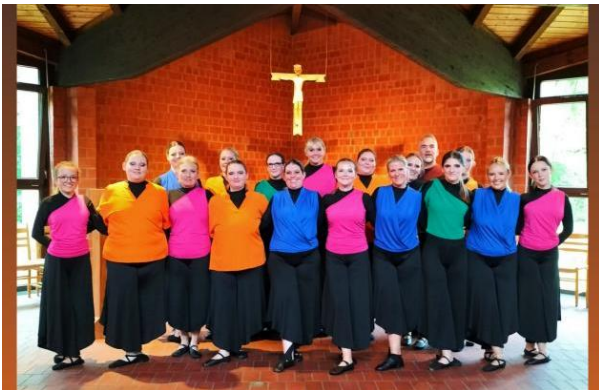
Beginn: 17.00 Uhr, St. MH der Eintritt ist frei

Wir laden alle ein, sich einmal zu Beginn des Advents auf diese andere Form des Gebets einzulassen.