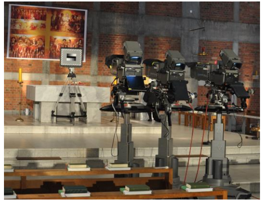
Text & Foto: Thomas Ricken

Im Anschluss an den Fernsehgottesdienst laden wir zum Kirchenkaffee vor und in die Bücherei ein.